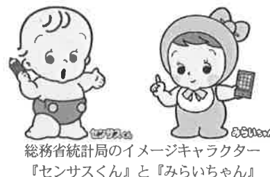
総務省統計局のイメージキャラクター 『センサスくん』と『みらいちゃん』

※新型コロナウイルス感染症の影響による調査スケジュールの延長措置に伴い、結果の公表時期を前回よりも延期